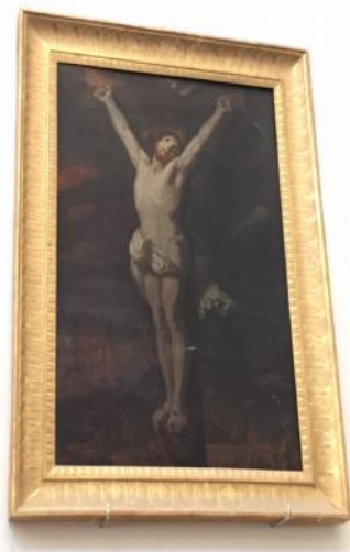
Crocifissione nella chiesa del Carmine

Un gruppo maiorese è andato in gita a Napoli e ha rinvenuto un'opera pittorica riprodotta da maioresi!